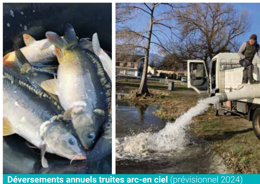
Déversements annuels truites arc-en ciel (prévisionnel 2024)

NOUVEAUTÉ 2024 : Lac du Bourget : 400 kg de truites (30 cm) (1 lâché par mois sur les premiers mois de l'année).